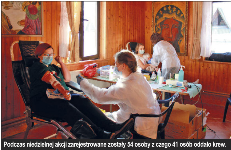
Podczas niedzielnej akcji zarejestrowane zostały 54 osoby z czego 41 osób oddało krew.

10 stycznia dzięki Parafialnemu Zespołowi Caritas, OSP Węglówka, Gminie Wiśniowa oraz Centrum Krwiodawstwa – Oddział Myślenice, po raz pierwszy w Węglówce odbyła się akcja krwiodawstwa.