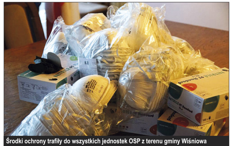
Środki ochrony trafiły do wszystkich jednostek OSP z terenu gminy Wiśniowa

Wszystkie jednostki OSP zostały doposażone w maski jednorazowe z filtrem FFP 2 oraz zapas rękawiczek jednorazowych, w celu ochrony zdrowia strażaków ochotników w czasie prowadzonych działań ratowniczych, prewencyjnych i profilaktycznych.